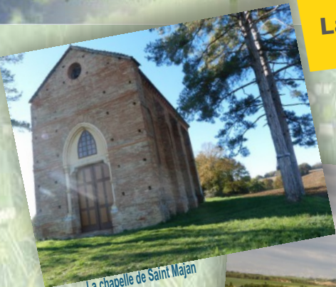
La chapelle de Saint-Majan