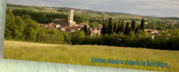
Lombez depuis la chapelle de Saint-Majan

Au VI ème siècle Majan, confesseur d'Antioche, venu d'Orient, vient évangéliser Lombez et le Savès, après avoir traversé les lieux saints d'Italie et d'Espagne. A sa mort, en 610, il est inhumé sur le coteau qui domine Lombez, où est édifiée une chapelle à sa mémoire. Il devient le Saint Patron du village et du Savès.