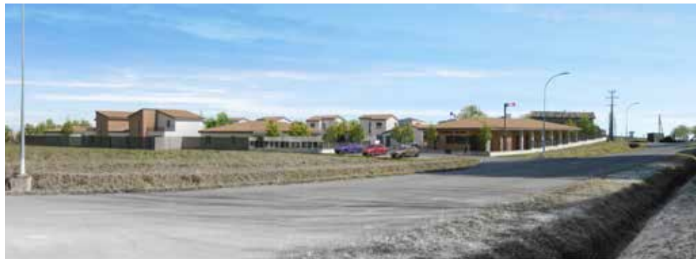
MR3A (Plan d'insertion)

Début des travaux envisagé au premier semestre 2023 pour une mise en service fin 2024.